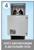
4 ПОСТ АККУМУЛЯЦИИ И ДЕГАЗАЦИИ ГАЗА