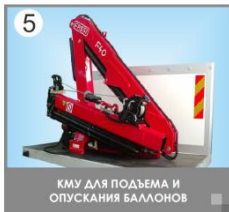
5 КМУ ДЛЯ ПОДЪЕМА И ОПУСКАНИЯ БАЛЛОНОВ

Мобильный комплекс по переосвидетельствованию баллонов типа КПГ -3 позволяет проводить работы по испытаниям баллонов без отрыва от точки эксплуатации техники.