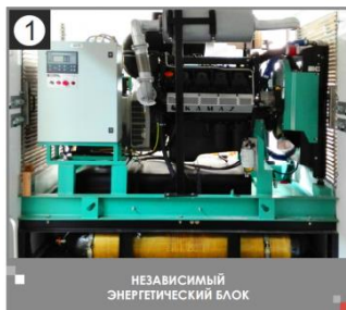
1 НЕЗАВИСИМЫЙ ЭНЕРГЕТИЧЕСКИЙ БЛОК