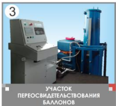
3 УЧАСТОК ПЕРЕОСВИДЕТЕЛЬСТВОВАНИЯ БАЛЛОНОВ