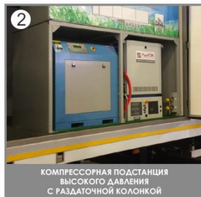
2 КОМПРЕССОРНАЯ ПОДСТАНЦИЯ ВЫСОКОГО ДАВЛЕНИЯ С РАЗДАТОЧНОЙ КОЛОНКОЙ